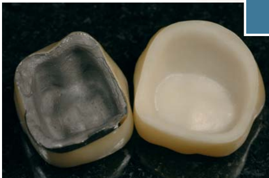
Corona a sinistra: restauro tradizionale in metallo ceramica. Corona a destra: Lava™, grazie alla totale assenza di metallo permette il passaggio della luce al suo interno esattamente come nei denti naturali.