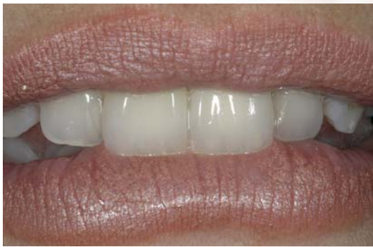
Caso clinico dopo il restauro. Il restauro Lava™ garantisce un'estetica perfetta e la massima biocompatibilità.