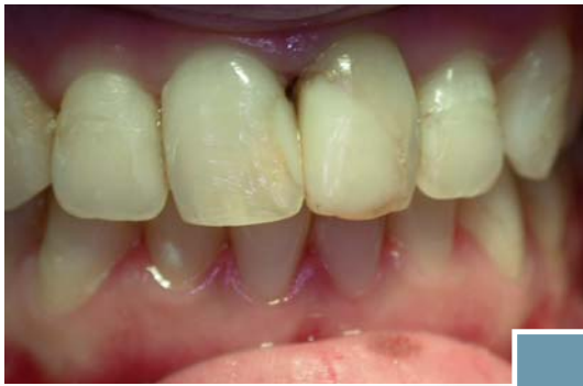
Caso clinico prima del restauro.